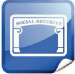
Tarjeta de Seguro Social