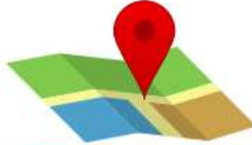
Comprobante de Domicilio