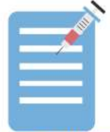
Registros de Vacunas