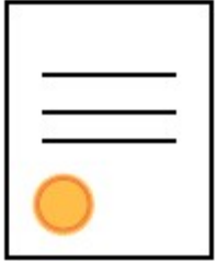
Certificado de Nacimiento